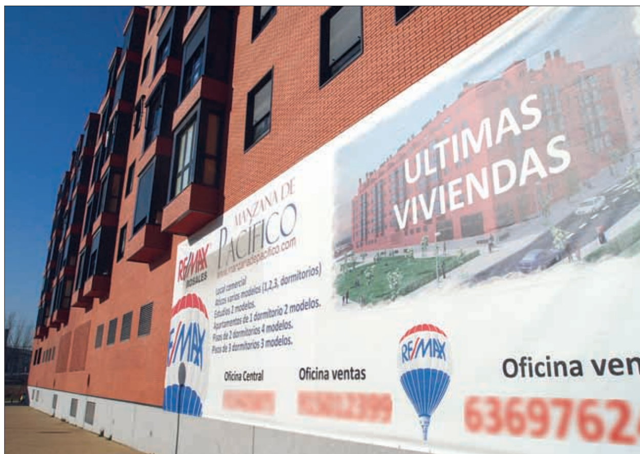
Las nuevas promociones de vivienda siguen estancadas, sin registrarse apenas ventas pese a la bajada de precios. Mientras la situación de las familias y las dificultades de los bancos para conceder préstamos continúen, la situación inmobiliaria se mantendrá.

El metro cuadrado de los pisos nuevos bajó un 3% en la capital, situándose en 3.191 euros. El alquiler, sin embargo, disminuyó sólo un 1,3%, aunque sube en tres distritos Págs. 2-3