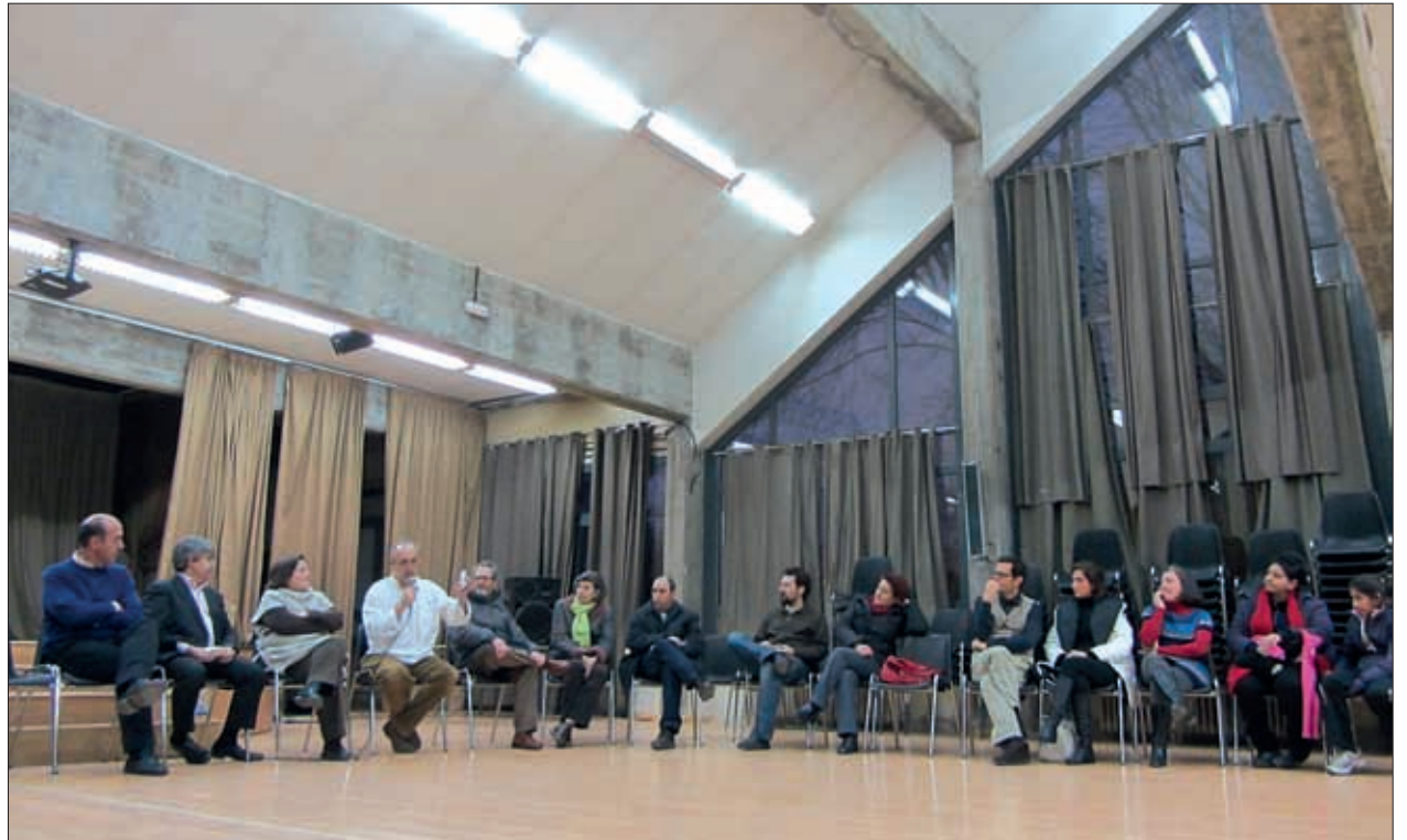
El instituto de educación secundaria Arturo Soria acogió, el pasado viernes 13 de enero, la presentación oficial del Banco del Tiempo de Manoteras, una iniciativa de la asociación del barrio que está abierta a la participación de todos los vecinos. En la imagen, un momento del acto.

Los interesados en participar pueden contactar en el ☎ 91 766 08 66 o en el correo info@bdtmanoteras.org.